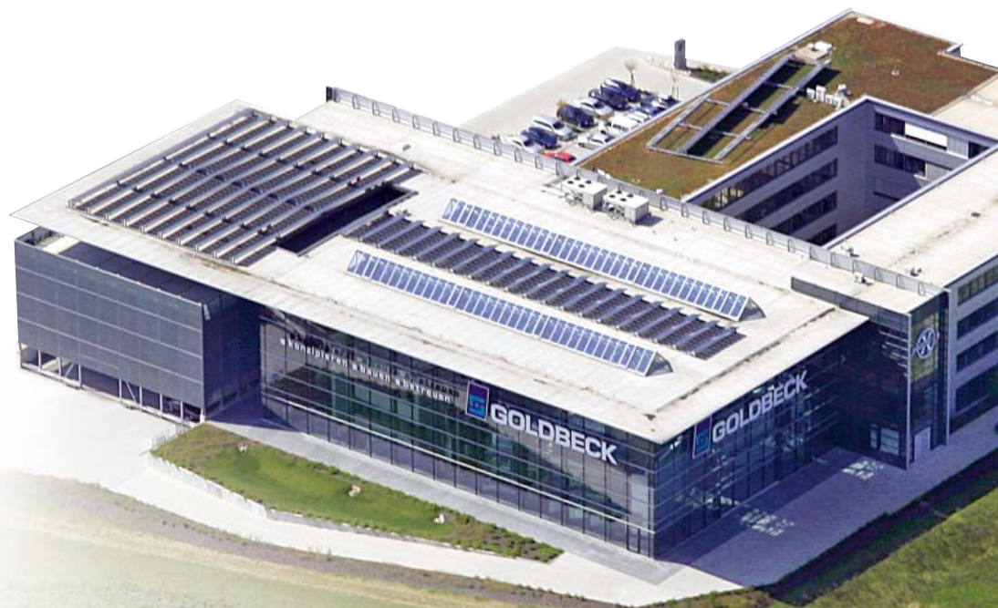
GOLDBECK Hirschberg 37 kWp